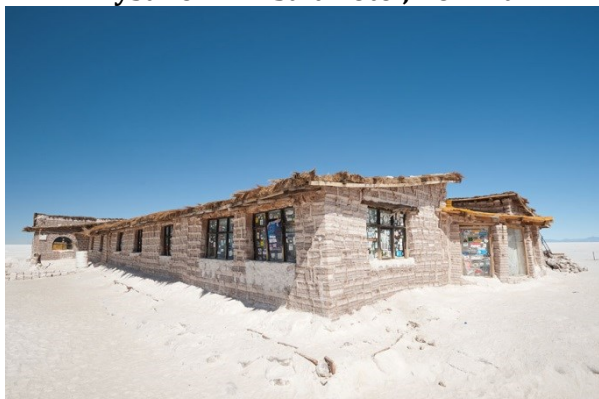
Rysunek 2.4. Salt Hotel, Boliwia