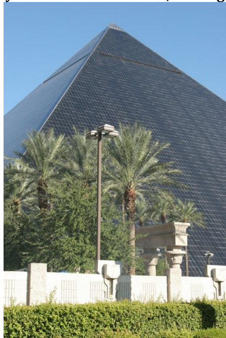
Rysunek 2.3. Luxor Hotel, Las Vegas