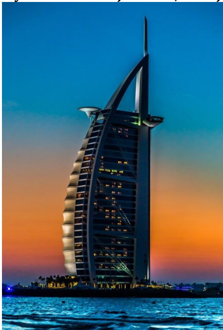
Rysunek 2.2. Burj Al Arab, Dubaj