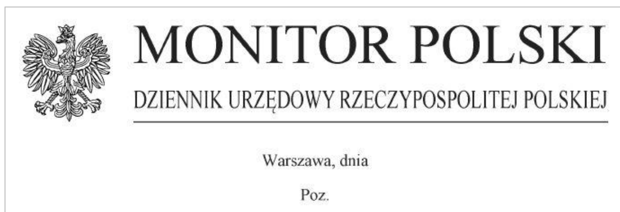
Rysunek 2.4 Strona tytułowa Dziennika Urzędowego Rzeczypospolitej Polskiej „Monitor Polski”