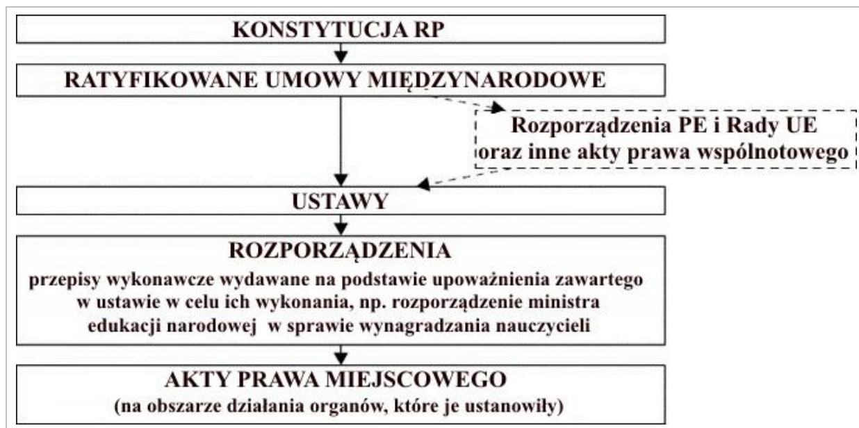
Rysunek 2.1 Hierarchia aktów prawnych