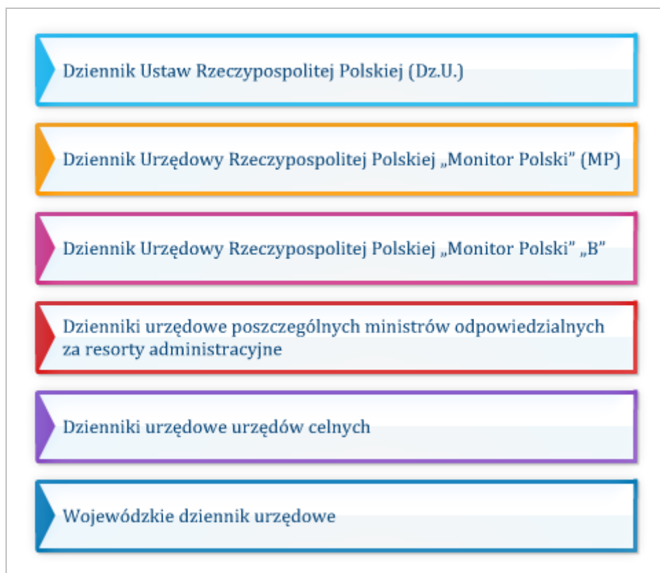
Rysunek 2.2 Wykaz dzienników urzędowych

Akta są publikowane w następujących dziennikach urzędowych: