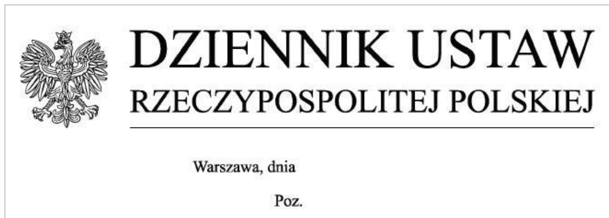
Rysunek 2.3 Strona tytułowa Dziennika Ustaw Rzeczypospolitej Polskiej