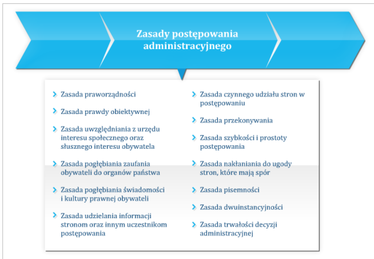
Rysunek 1.2 Zasady postępowania administracyjnego