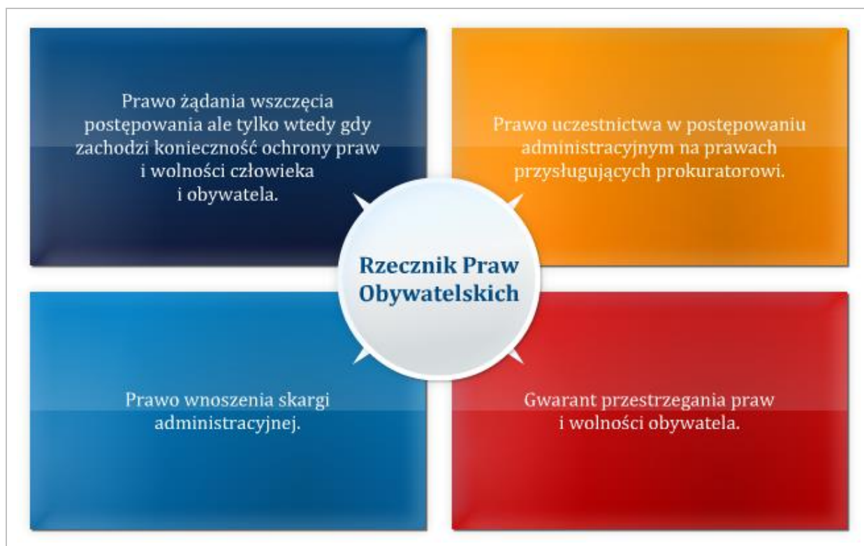
Rysunek 1.6 Prawa Rzecznika Praw Obywatelskich w postępowaniu administracyjnym