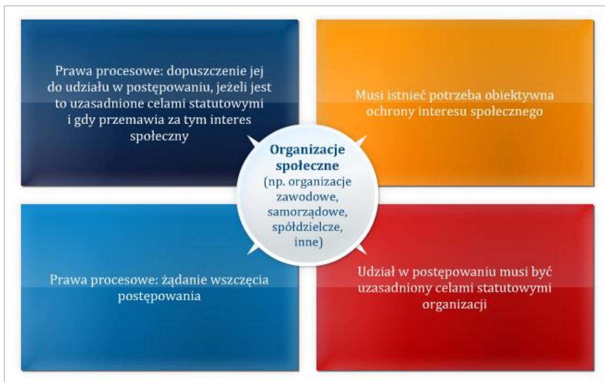
Rysunek 1.4 Zasady udziału organizacji społecznej w postępowaniu administracyjnym