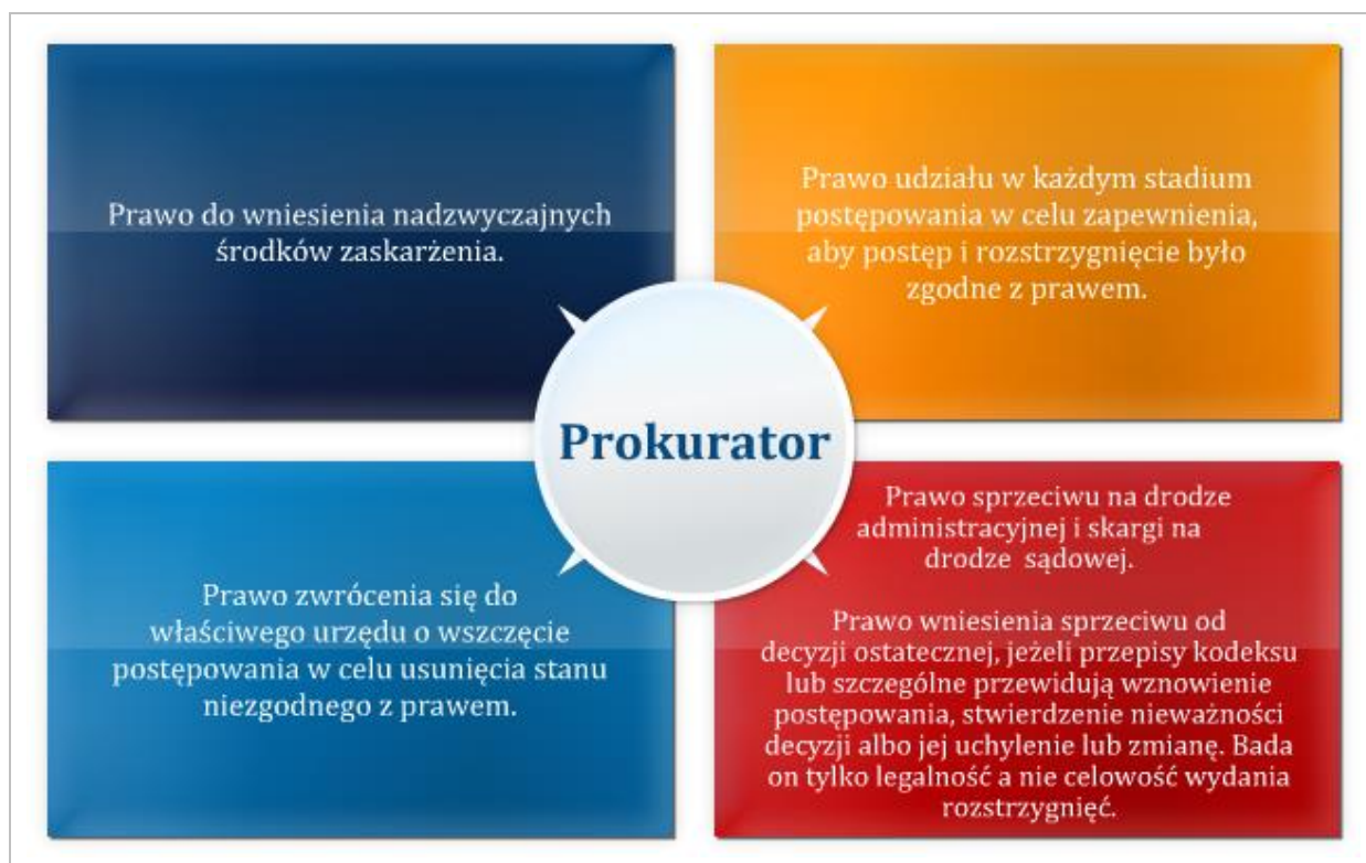
Rysunek 1.5 Prawa prokuratora w postępowaniu administracyjnym