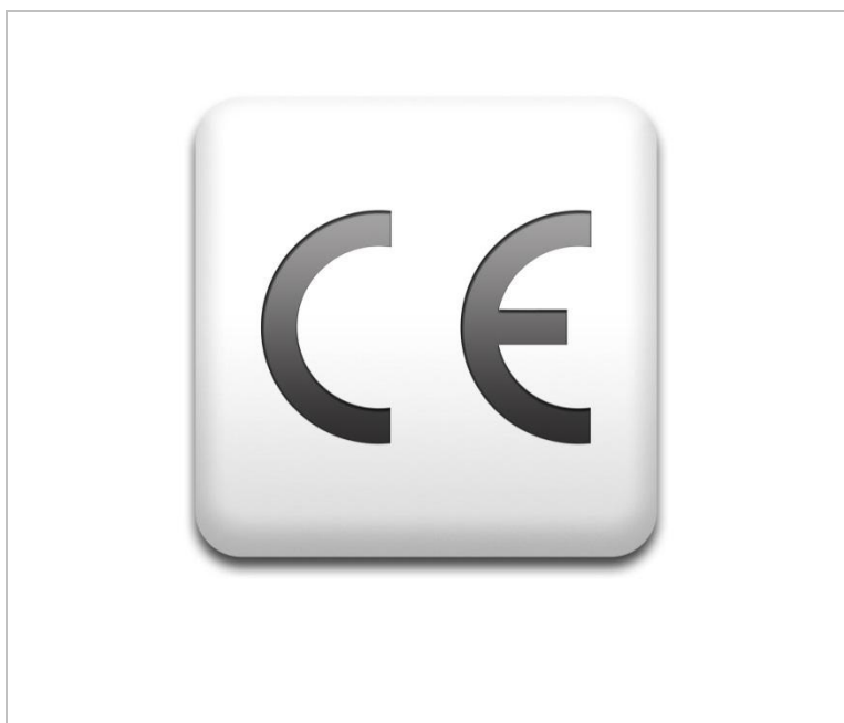
Rysunek 3.7 Znak CE

Na zabawkach stosuje się również znak CE , który jest deklaracją producenta, że określony produkt spełnia wymagania dyrektyw Unii Europejskiej.