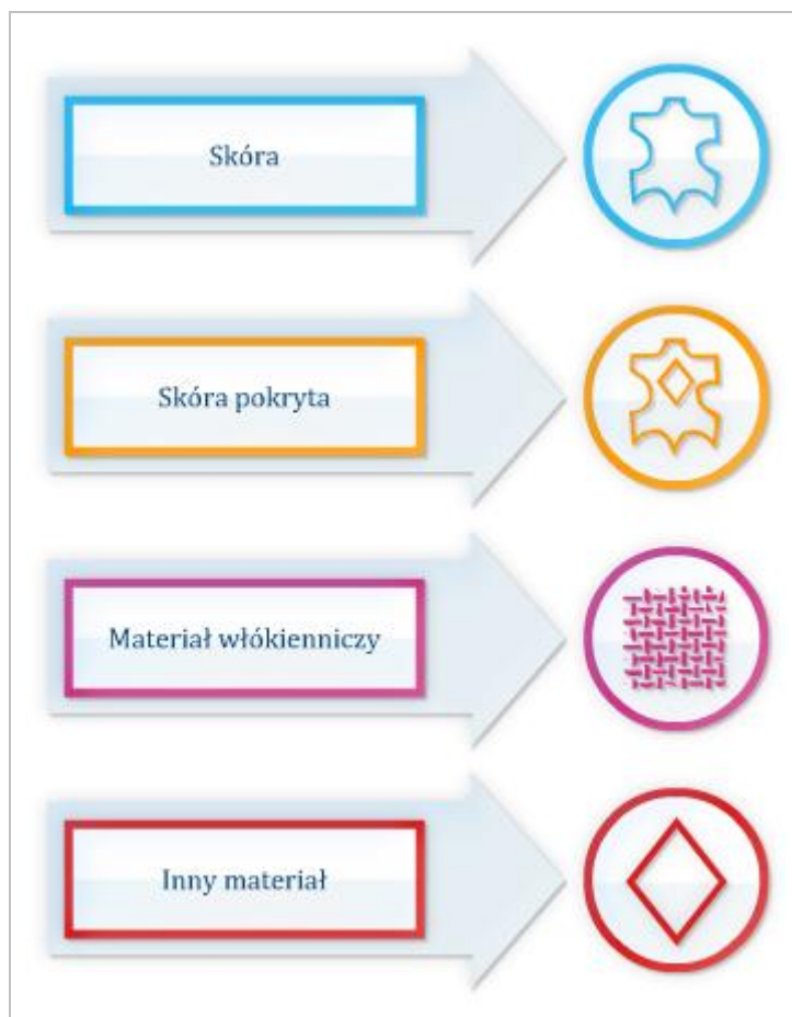
Rysunek 3.3 Materiały, z których wytworzone zostało obuwie