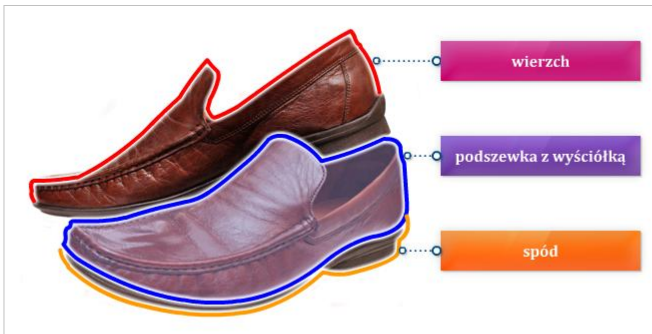
Rysunek 3.2 Znaki stosowane na obuwiu