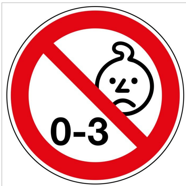
Rysunek 3.6 Oznaczenie – nieodpowiednie dla dzieci poniżej 3 lat