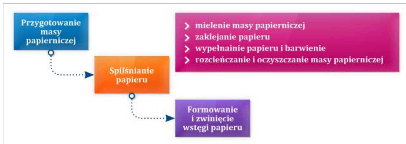
Rysunek 3.4 Proces technologiczny otrzymywania papieru