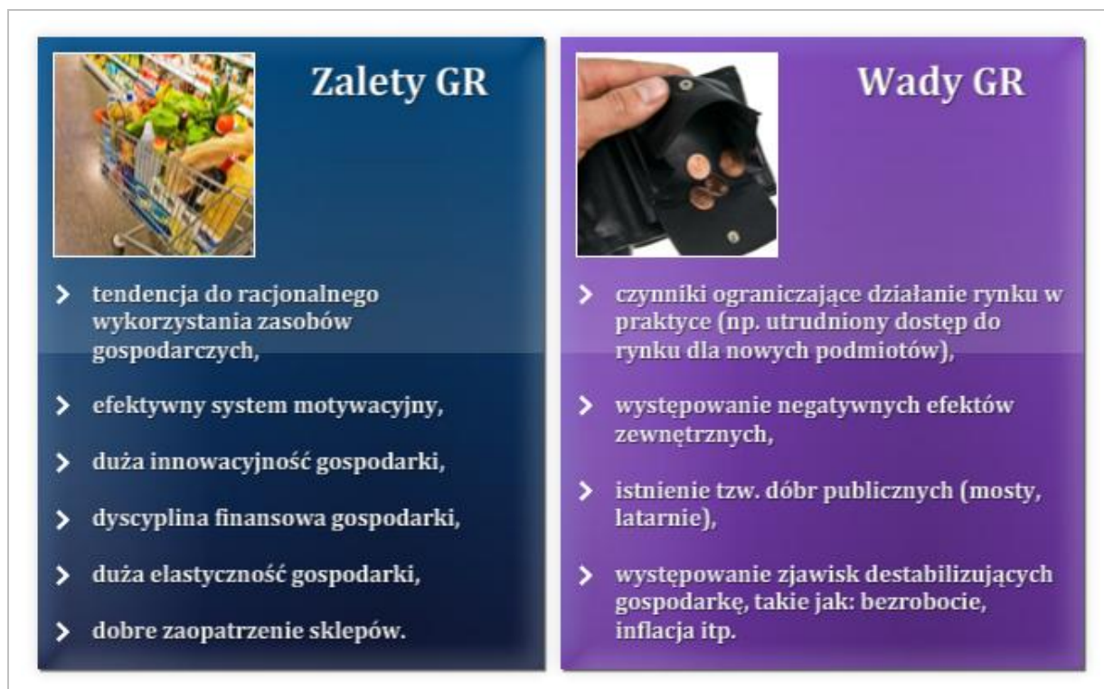
Rysunek 2.4 Wady i zalety Gospodarki rynkowej