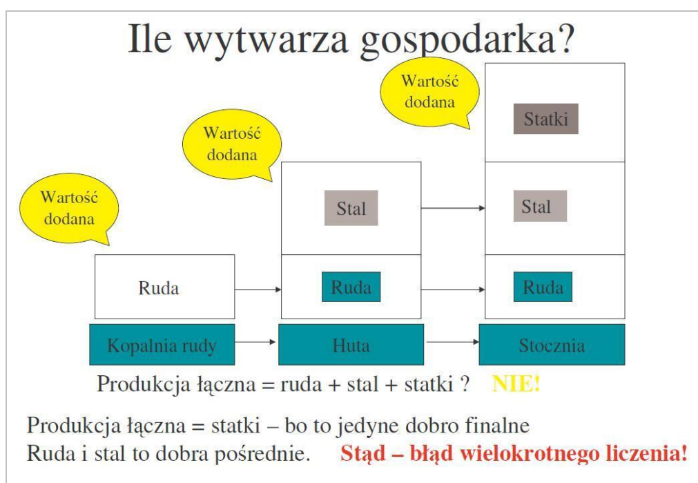
Rysunek 2.2 Ile wytwarza gospodarka?

PKB jest to suma popytu konsumpcyjnego, inwestycyjnego, zagranicznego oraz zakupy rządowe.