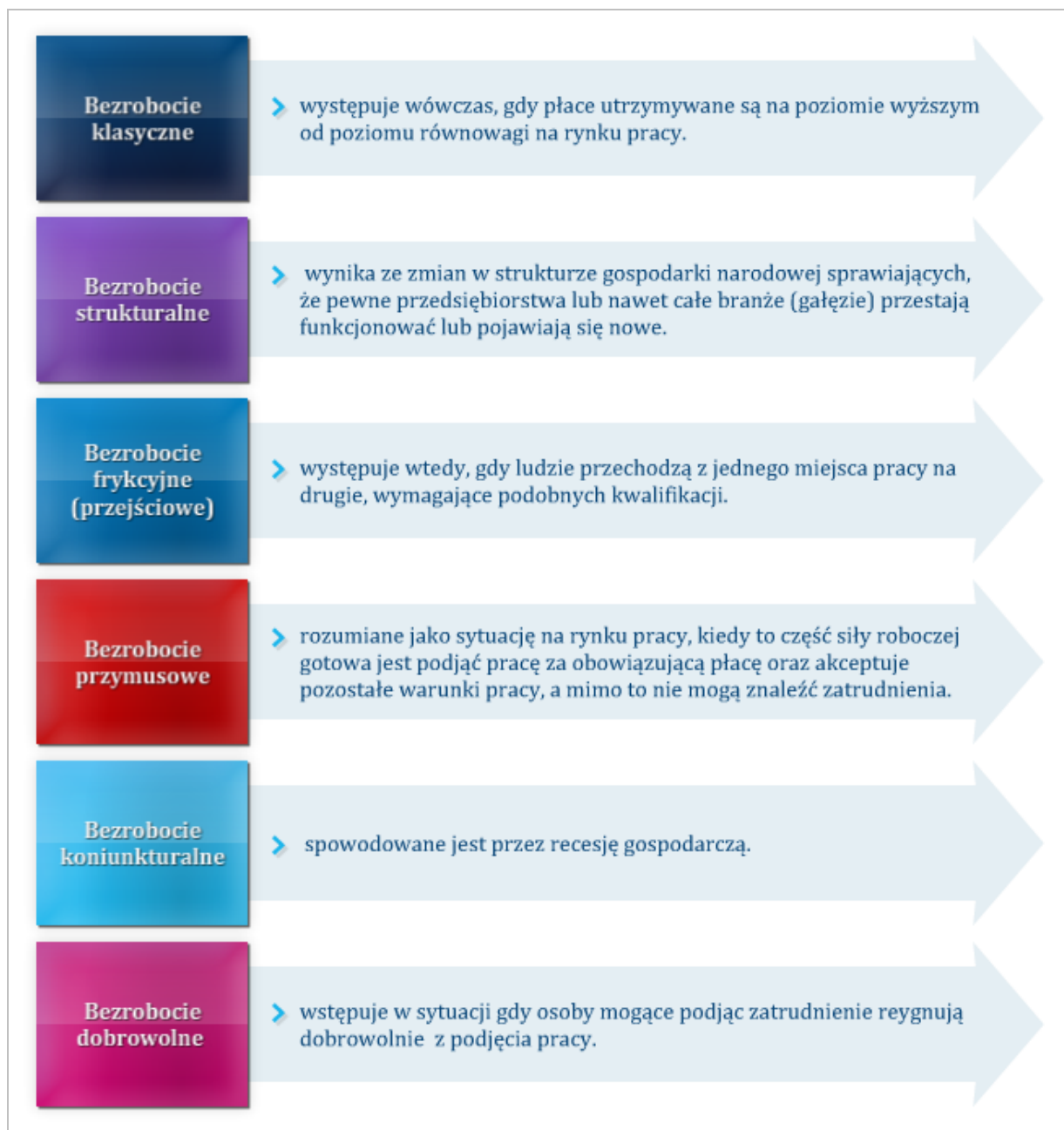
Rysunek 2.3 Podział podstawowych form bezrobocia

Źródło: opracowanie własne na podstawie Ambukita E., Skrypt Makroekonomia, Politechnika Poznańska