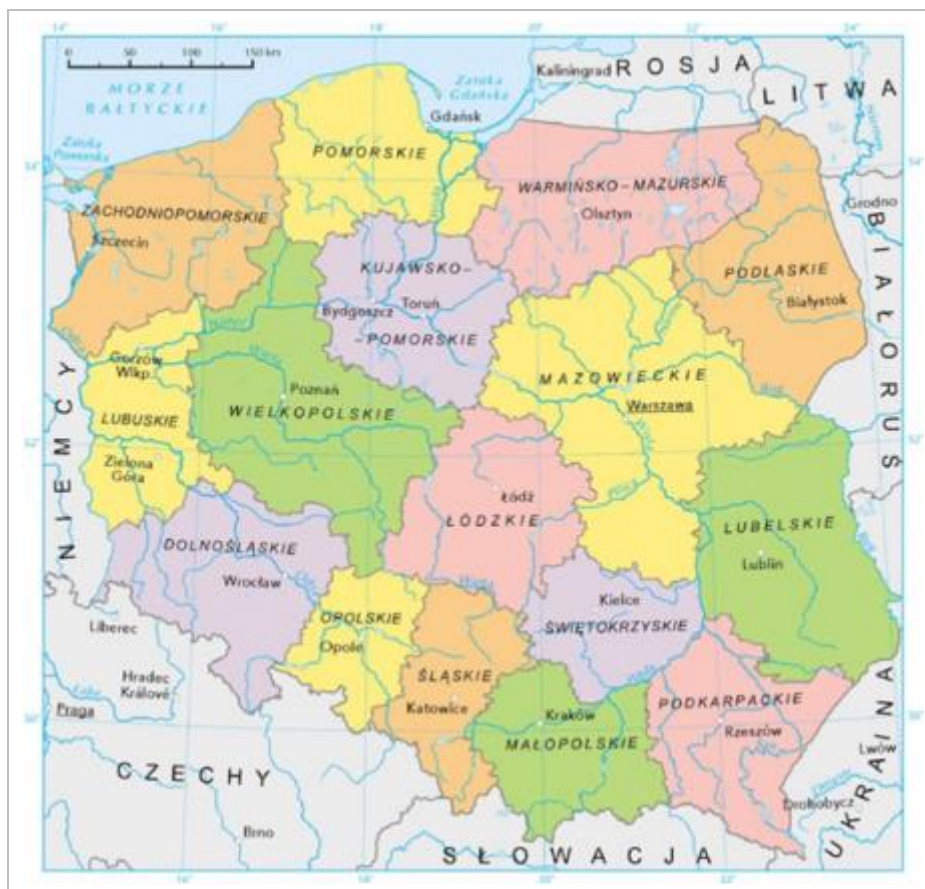
Rysunek 6.3 Mapa Polski – podział na województwa

państw, opartych na porozumieniach regionalnych władz samorządowych tych państw. Celem euroregionów jest rozwój sąsiedzkich kontaktów, integracji, współpracy gospodarczej, infrastruktury, ochrony środowiska, turystyki i działalności kulturalno-edukacyjnej i sportowej. Przykładowe euroregiony to: Pomerania (Polska, Niemcy, Szwecja), Nysa (Polska, Czechy, Niemcy) czy region Karpacki (Polska, Ukraina, Węgry, Słowacja, Rumunia).