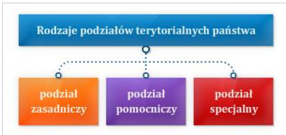
Rysunek 6.1 Rodzaje podziałów terytorialnych państwa