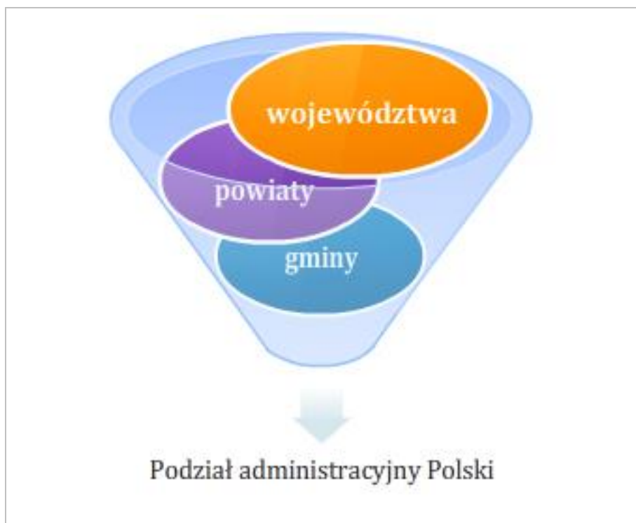
Rysunek 6.2 Trójstopniowy podział administracyjny Polski