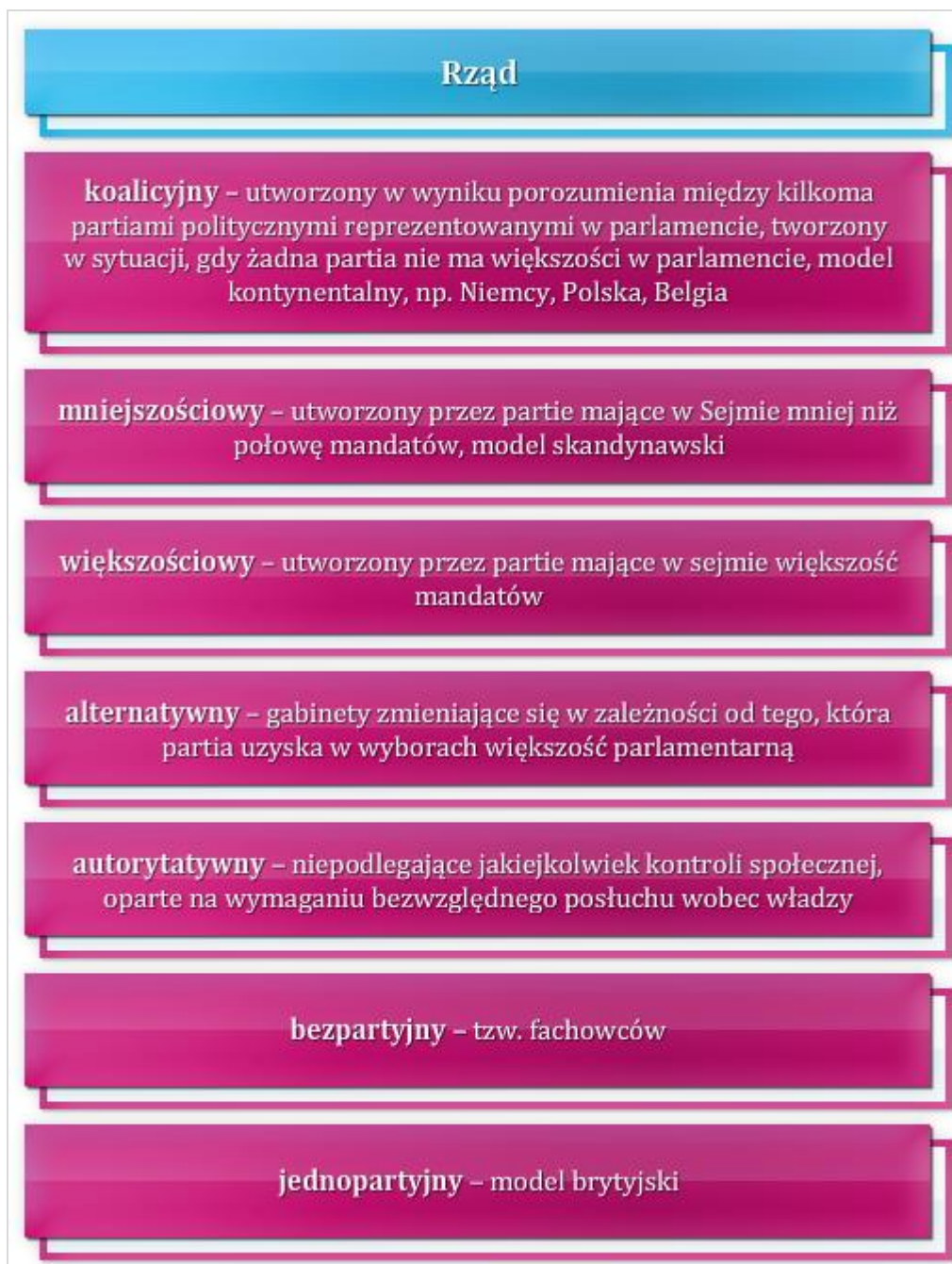
Rysunek 7.2 Różne postaci rządów

Najważniejszy organ zarządzający państwem składa się z premiera (prezesa Rady Ministrów), ministrów, ministrów bez teki. Wieloletnia historia wykształciła rodzaje rządów w postaci: