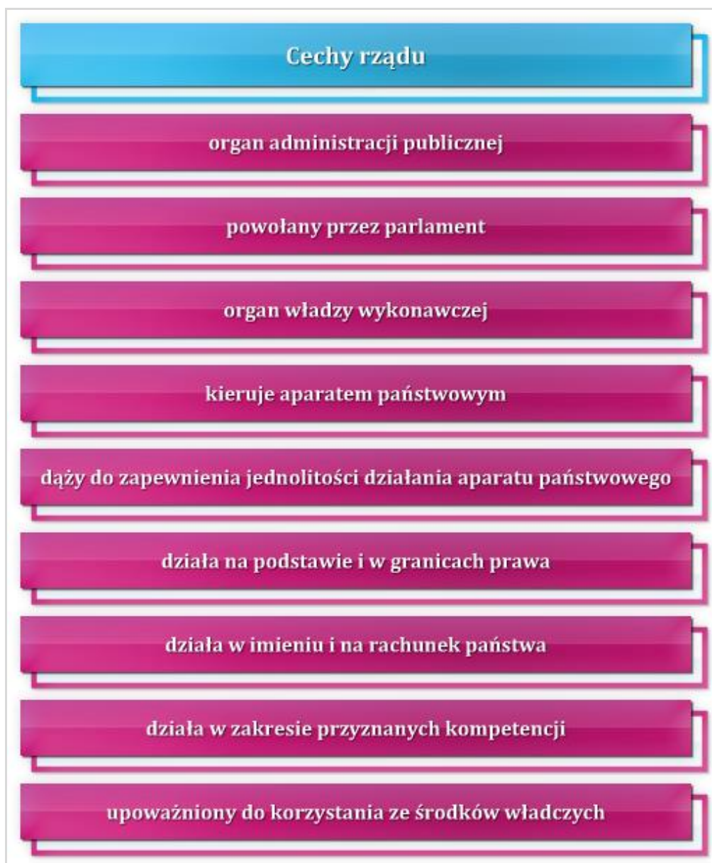
Rysunek 7.1 Cechy charakterystyczne rządu polskiego

Często czyta się w gazecie lub słyszy w telewizji: „rząd odniósł sukces”, „rząd umywa ręce”, „kto straci fotel w rządzie”, „poparcie dla rządu rośnie” itp. Co właściwie oznacza słowo „rząd”? To organ administracji publicznej powołany przez parlament. To wyodrębniony organ w zakresie władzy wykonawczej, który kieruje aparatem państwowym, dążący do zapewnienia jednolitości działania aparatu państwowego na podstawie prawa – powołany przez parlament.