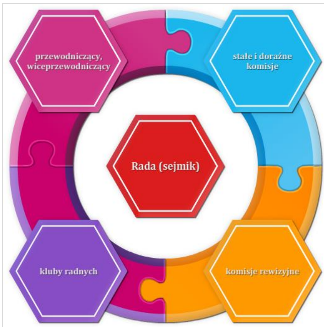
Rysunek 7.7 Organy towarzyszące radzie

Rada (sejmik) obraduje na sesjach zwoływanych przez przewodniczącego co najmniej raz na kwartał.