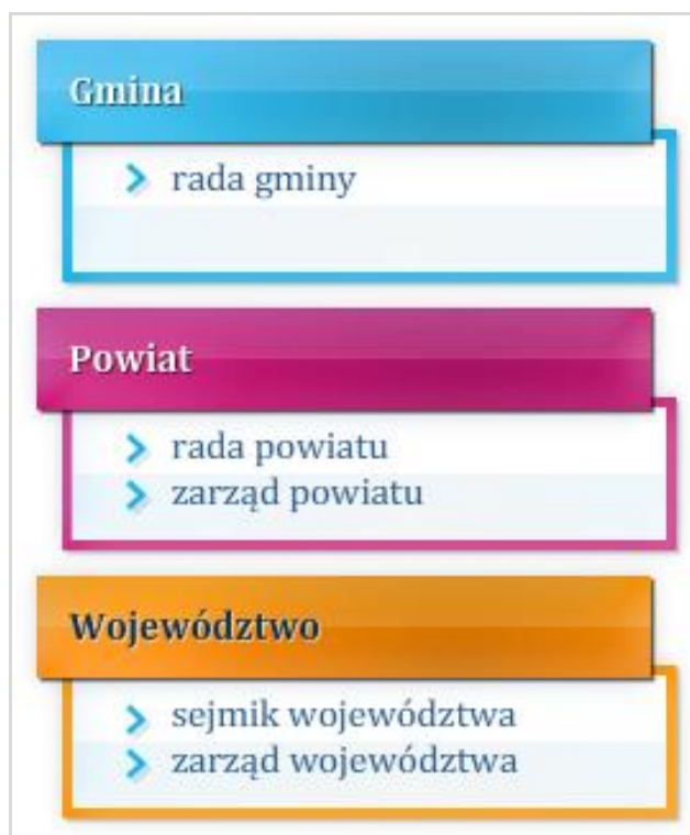
Rysunek 7.8 Organy wykonawcze jednostek samorządu terytorialnego

Zarząd jest organem wykonawczym w poszczególnych jednostkach samorządu terytorialnego. W skład zarządu wchodzi: