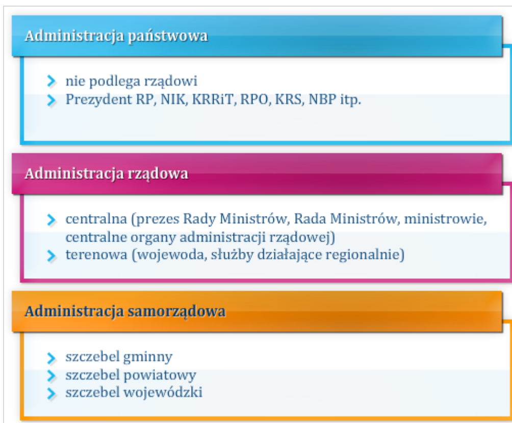
Rysunek 7.4 Inny podział administracji publicznej w Polsce