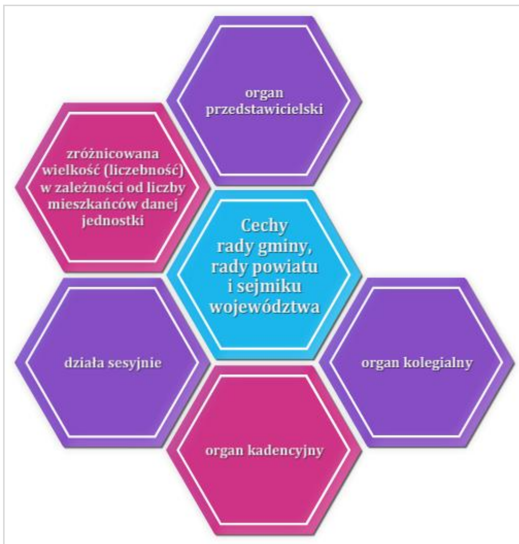
Rysunek 7.6 Cechy organów stanowiących i kontrolnych

Rada gminy, rada powiatu i sejmik województwa są organami stanowiącymi i kontrolnymi jednostek samorządu terytorialnego. Cechy tych organów przedstawiono na schemacie (rysunek 7.6).