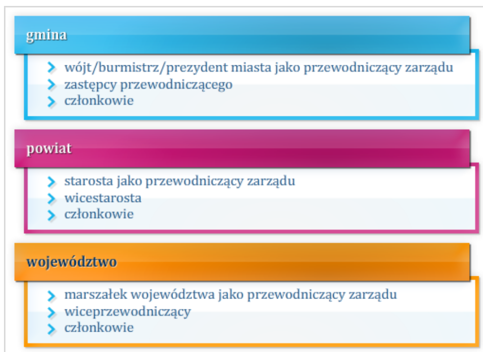
Rysunek 7.5 Struktura organów samorządu terytorialnego

W Polsce od 1 stycznia 1999 r. obowiązuje zdecentralizowany system administracji publicznej. W związku z tym struktura samorządu terytorialnego wygląda następująco: