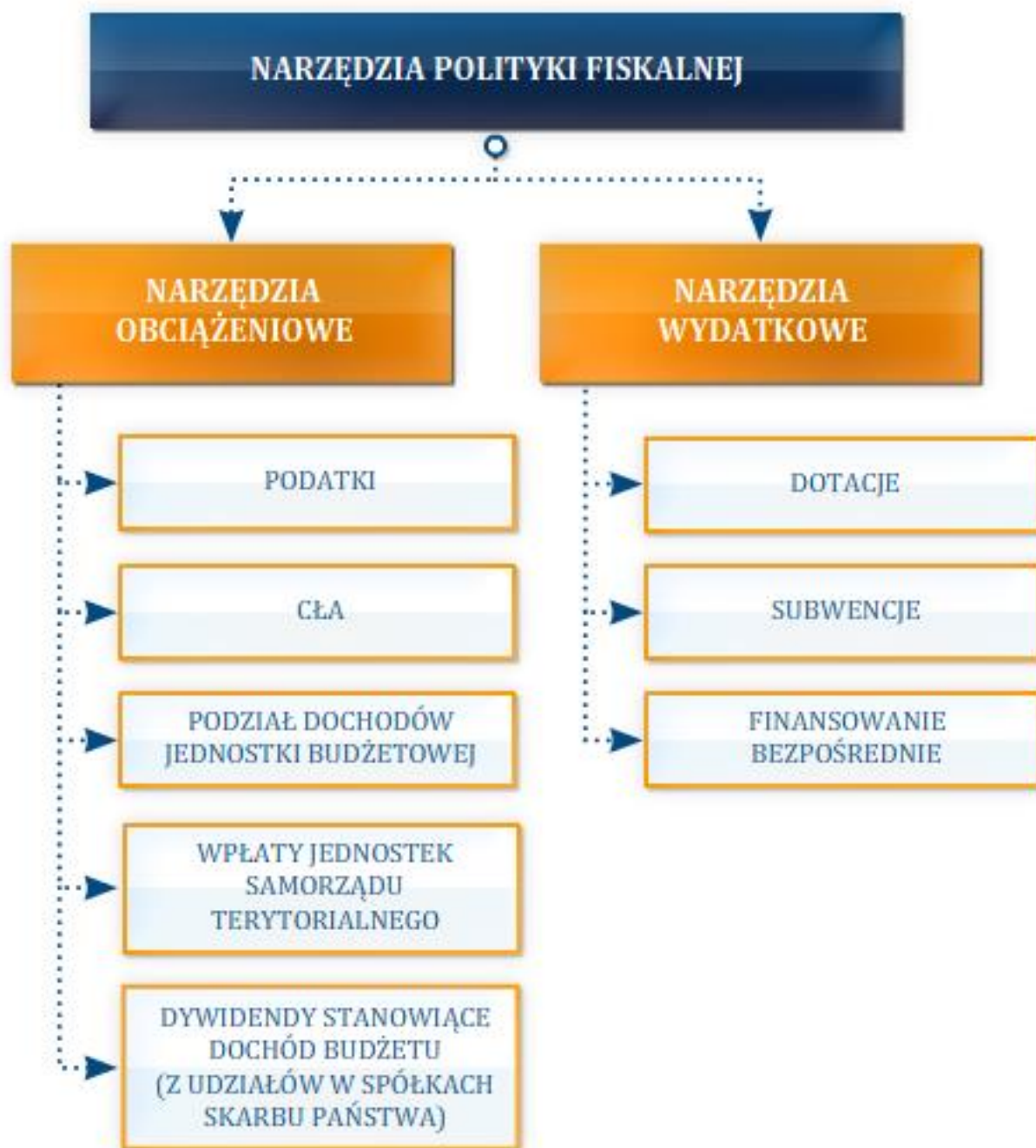
Rysunek 8.2 Narzędzia polityki fiskalnej